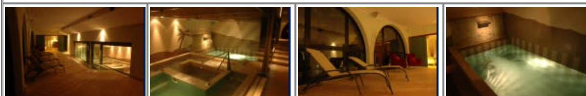
Il centro benessere