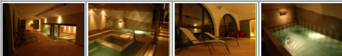
Il centro benessere