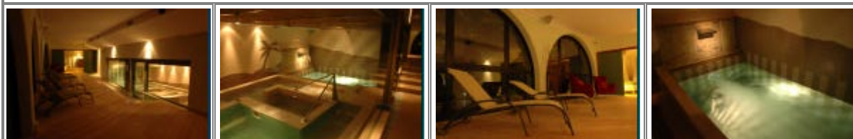
Il centro benessere