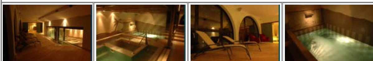
Il centro benessere