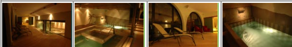
Il centro benessere